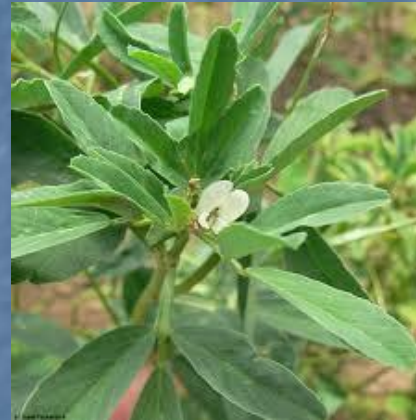
Pískavice – Řecké seno – rozemletá semena