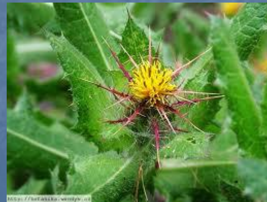
Benedikt lékařský – listy a květ